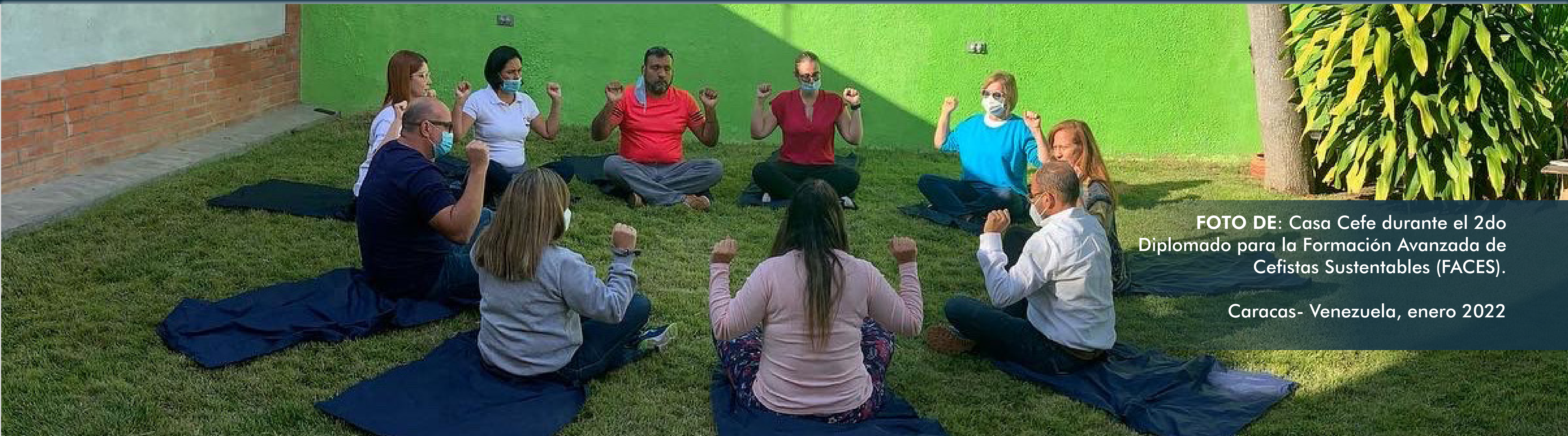
FOTO DE: Casa Cefe durante el 2do Diplomado para la Formación Avanzada de Cefistas Sustentables (FACES).