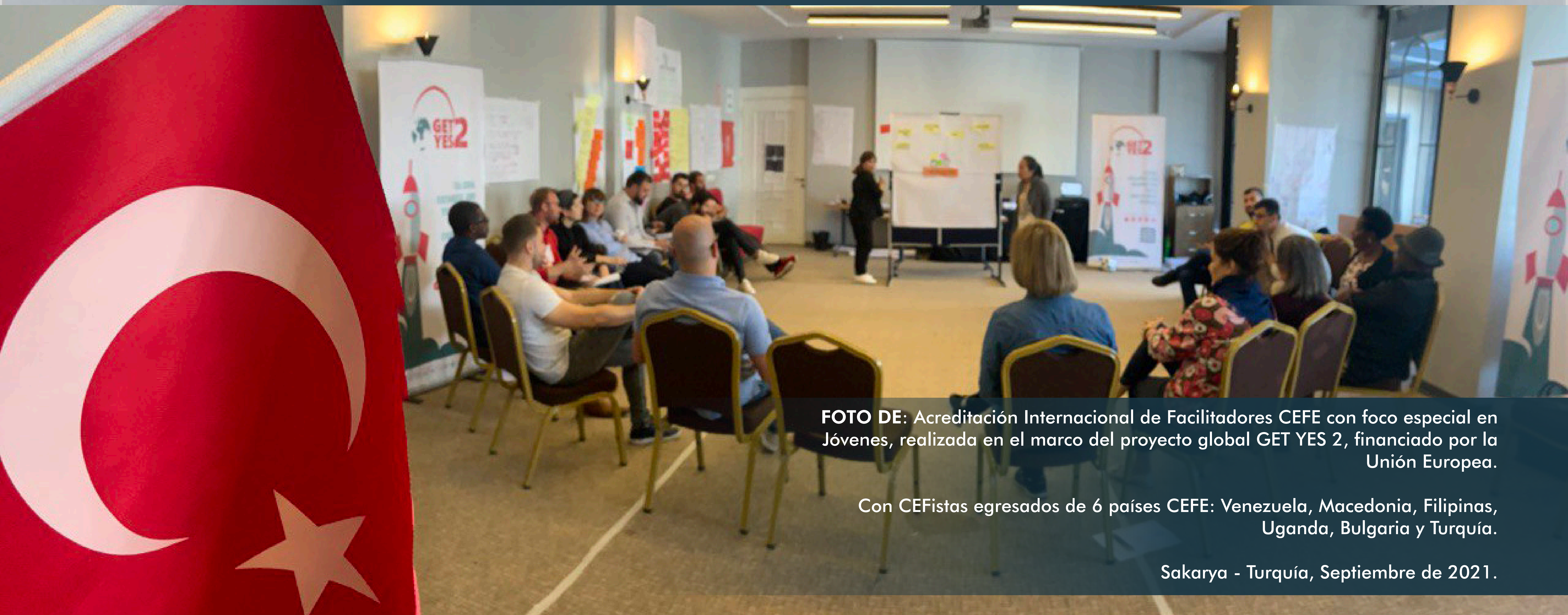
FOTO DE: Acreditación Internacional de Facilitadores CEFE con foco especial en Jóvenes, realizada en el marco del proyecto global GET YES 2, financiado por la Unión Europea.

Durante 12 días distribuidos en 3 semanas continuas (4 días continuos cada semana), más algunos encuentros digitales, los Futuros CEFistas, vivencian 3 grandes módulos en los que comienzan experimentando la Metodología CEFE desde la participación (aun no como facilitadores sino como participantes del proceso de aprendizaje liderado por los Master Trainers a cargo de la acreditación), paseándose por la comprensión del método, sus aplicaciones a nivel global, sus manuales y por último, por las ejecuciones CEFE o prácticas CEFE (sus primeros macro laboratorios como CEFistas), en promedio de 2 horas cada una de ellas. En esta etapa final, no sólo viven sus propias prácticas asignadas, sino también cada una de las prácticas de sus compañeros en formación, siendo participantes de las mismas, y en las que tendrán el reto de entregar un feedback al momento de que sus compañeros finalicen su práctica, el momento en donde se producen los más ricos aprendizajes de manera colaborativa entre los Futuros CEFistas que conforman el TOT.